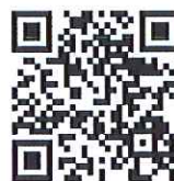
鹿児島県レク協会

この「RECREATION かごしま」も、予定通り年3回発行することができました。来年度も、更に内容の濃い誌面ができたかと思っていますので、広報誌についての御意見、御要望等がありましたら、ぜひお聞かせください。来年度もよろしくお祈りいたします。