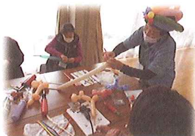
簡単バルーンアートに挑戦