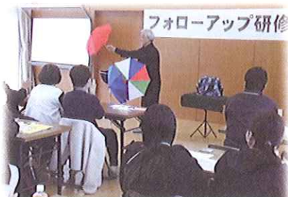
やさしいマジック講座

講師の皆様、ご参加の皆様、お手伝いいただいた皆様、差し入れをしていただいた皆様、本当にありがとうございました。また、今回参加できなかった有資格者のみなさん、来年のフォローアップ研修会でぜひお会いしましょう。