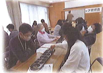
マンカラを楽しもう!